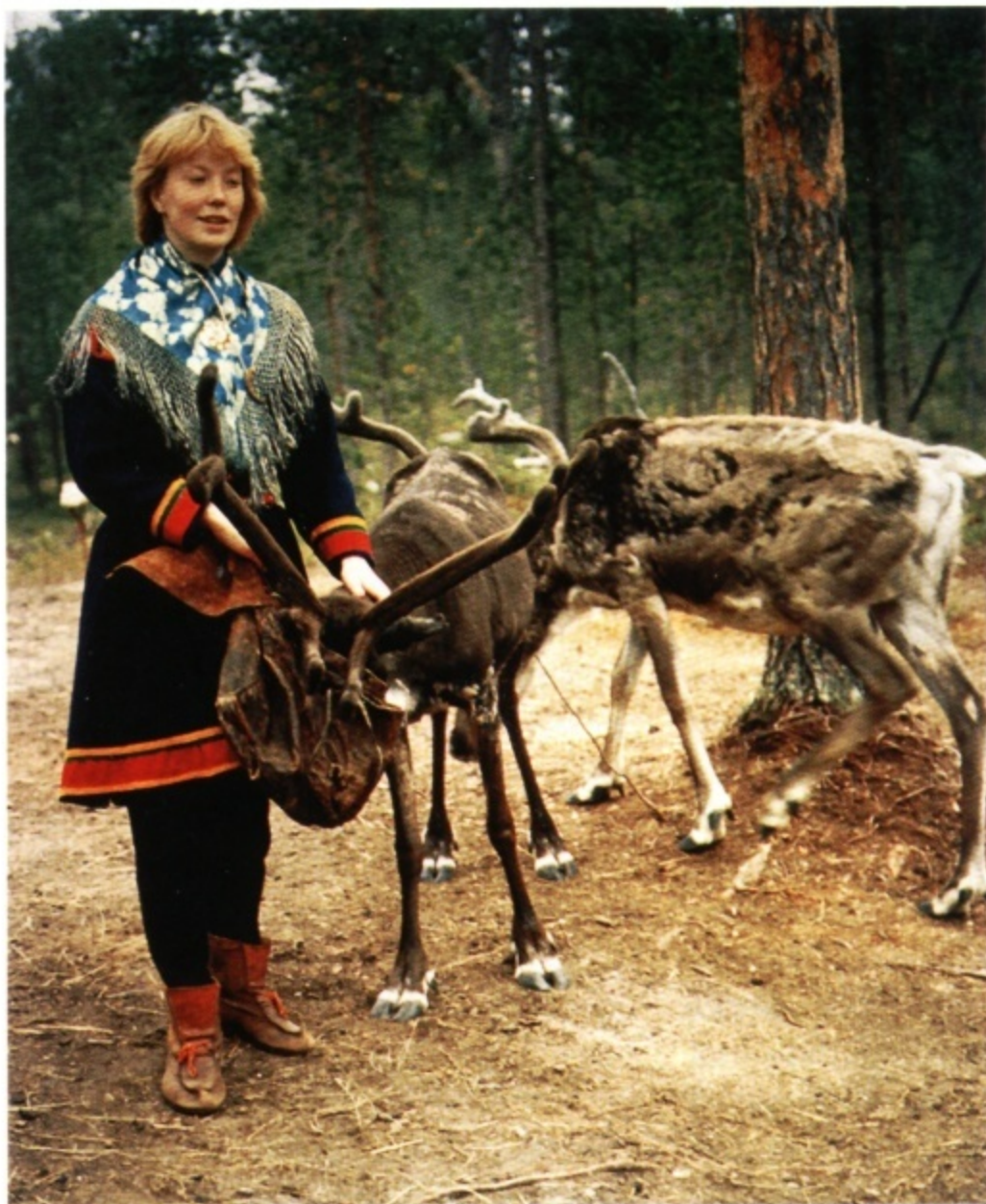
Eine junge Sámin aus Nordfinnland bei der Rentierfütterung. Ihr Volk gilt als das letzte „Urvolk“ Europas.

Schon am Morgen nach der Ankunft wurden zwei der Rentiere tot aufgefunden. Sie waren von der langen Reise zu sehr geschwächt. Die übrigen Tiere erholten sich zunächst und sorgten mit ihrer Herrin für eine erste „exotische Attraktion“ in Nordhessen. Doch bald fanden auch die restlichen „skandinavischen Ureinwohner“ das schon erwähnte traurige Ende.