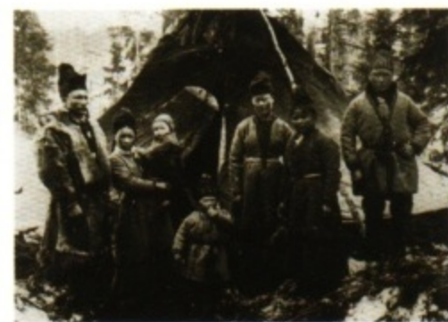
Sámifamilie der vergangenen Generation in Mittådalen, Schweden.

Trauer der Trennung von ihren Rentieren und geleitete sie als „wiedergefundene Schwester und Mutter“ zu den ewigen Weidegründen des Rentiervolkes. Die Zeremonie endete mit den Worten „sei nun ruhig und getrost, liebe Schwester, Mutter und Freundin, jetzt sollst Du auch mit dem Volk