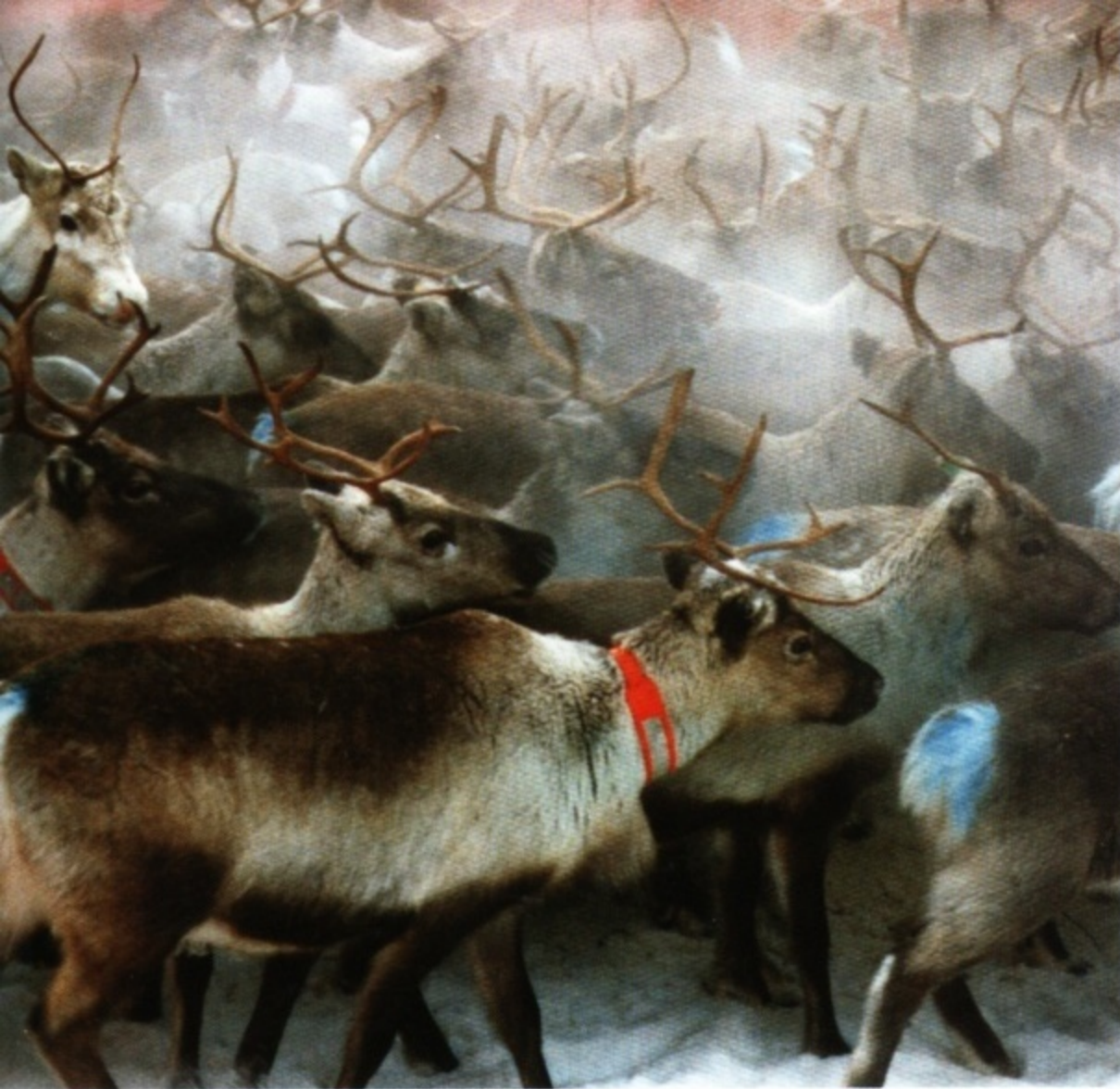
Rentiere beim jährlichen „Round-up“. Die Jungtiere werden gekennzeichnet und wieder in die Wildnis gelassen.